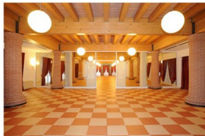
SALA DEGLI SCACCHI